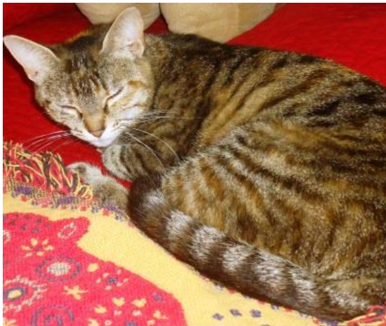
Fiona, chatte au fort caractère qui attend une famille patiente et douce

Tous les chats de notre refuge sont vaccinés, stérilisés et identifiés, c'est pour ces raisons qu'une participation vous est demandée lors d'une adoption.